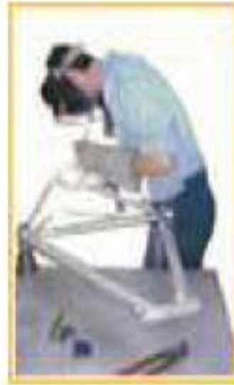
11 - مركز اللحام اليدي

12 - أبين التطور الحاصل بين مركز اللحام اليدي ومركز اللحام الآلي. التطور الحاصل بين مركز اللحام اليدي ومركز اللحام الآلي يتمثل في: أن اللحام الآلي أكثر دقة في العمل وأكبر سرعة في الإنجاز. أن اللحام الآلي يضمن للعامل سلامة أفضل من الحرارة والأشعة.