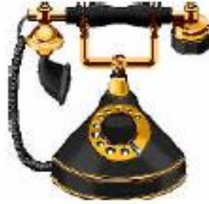
5 - هاتف قار

6 - أيبين التطور الحاصل بين هاتف قار و هاتف محمول. . الهاتف القار يستعمل من مكان ثابت. . الهاتف المحمول يمكن مستعمليه من التواصل من أي مكان تواجد فيه حتى وإن كان في حالة حركة.