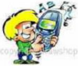
6 - هاتف محمول