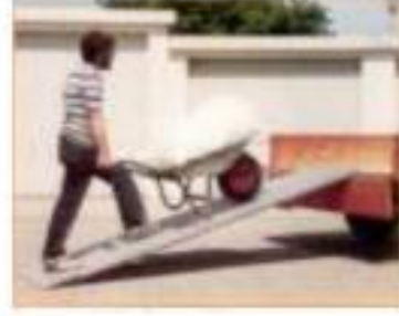
3 - عربة يدوية

4 - أيبين التطور الحاصل بين عربة يدوية وجرّار. . الجرّار يشتغل بمحرك والعربة تدفع يدويا. . الجرّار أسرع من العربة اليدوية. . الجرّار حمولته أكبر من العربة اليدوية.