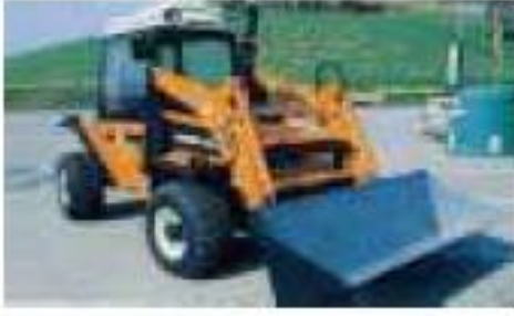
4 - جرّار