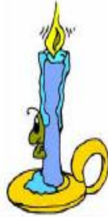
9 - شمعة

10 - أبين التطور الحاصل بين شمعة وأضواء الشوارع. التطور الحاصل بين الشمعة وأضواء الشوارع يتمثل في: مدة استعمال الشمعة قصيرة. قدرة إنارة أضواء الشوارع أكبر.