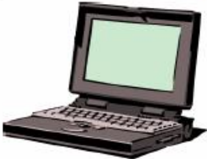
8 - حاسوب محمول