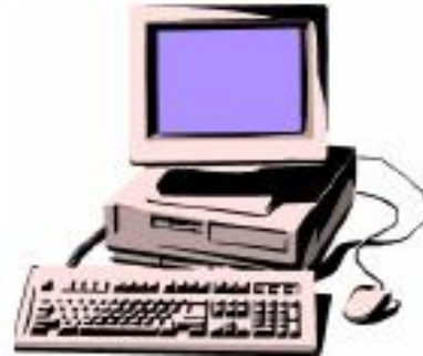
7 - حاسوب قار

8 - أيبين التطور الحاصل بين حاسوب قار و حاسوب محمول. التطور الحاصل بين الحاسوبين يتمثل في: . الشكل والحجم . (مثل الهاتف)