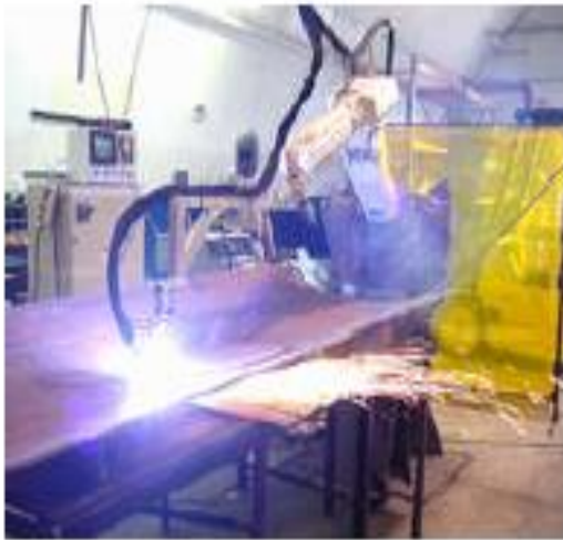
12 - مركز اللحام الآلي