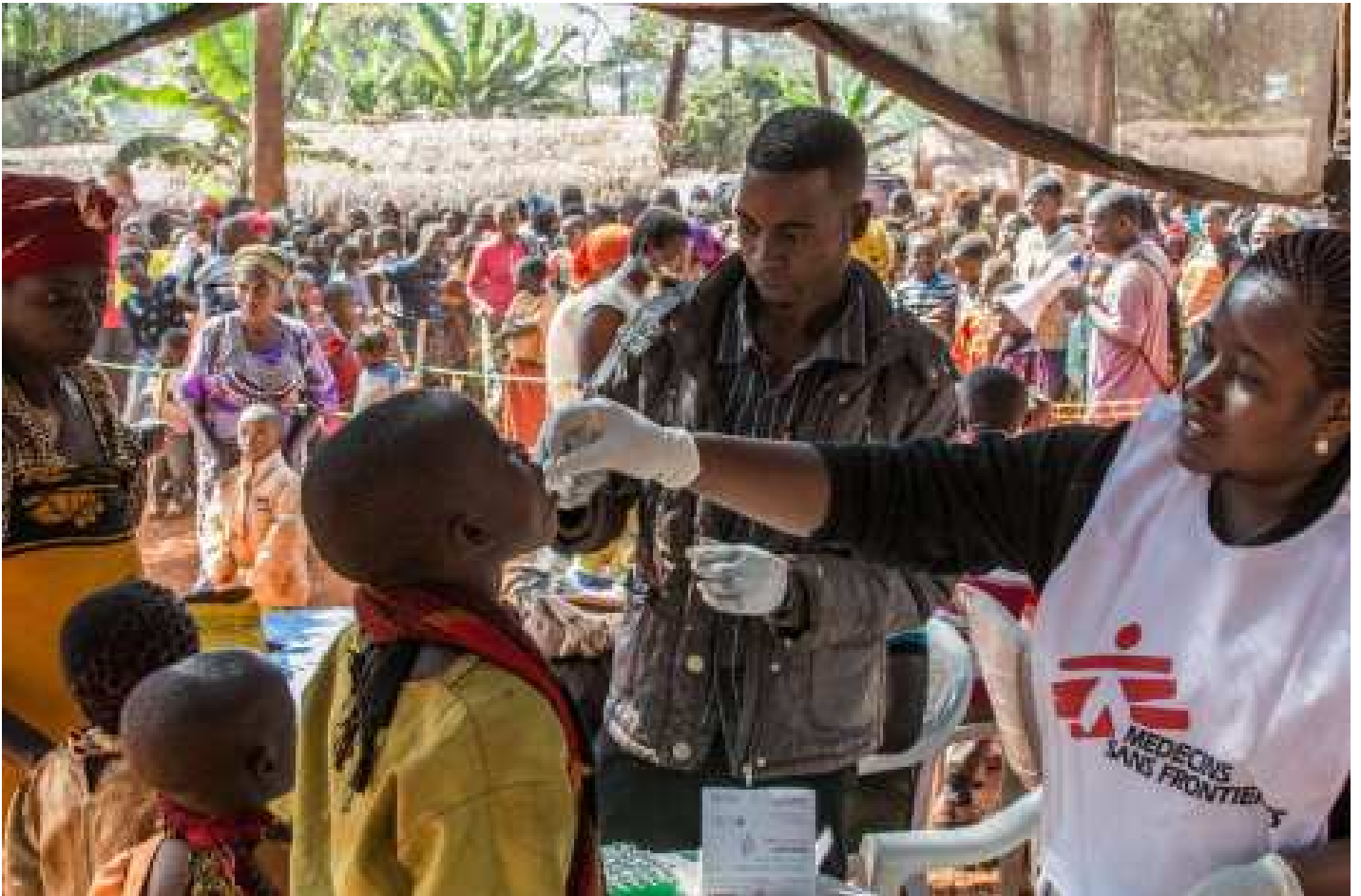
حملة تلقيح ينظّمها أطباء بلا حدود

يلتزم كلّ المنضويين لأطباء بلا حدود بالأخلاقيّات الطبيّة وبالحياد وعدم التّحيّز. فمن الأسس التي قامت عليها المنظمة تقديم الرّعاية الصّحيّة لمن يحتاجها بغضّ النّظر عن الدّين أو الإلتناء السّياسي.